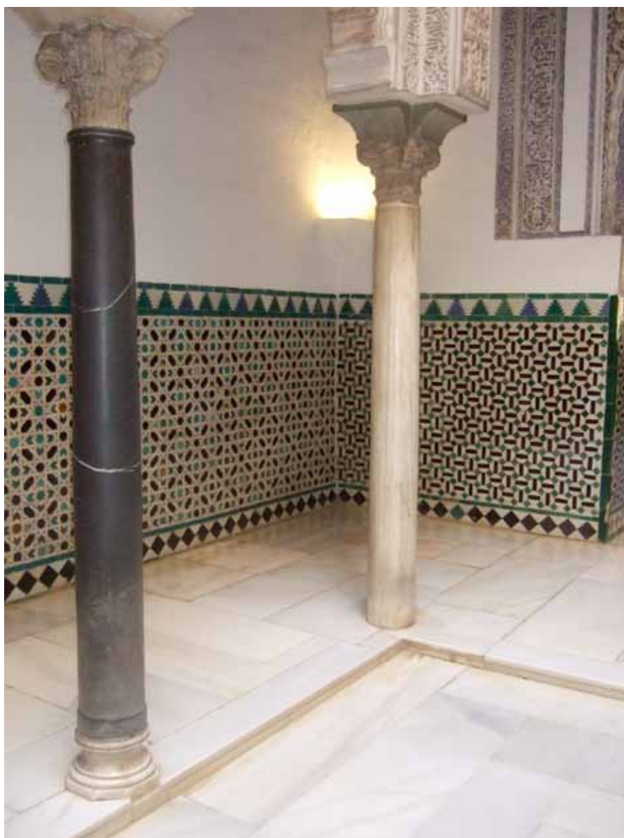
Fig. 2. Patio de las Muñecas. Real Alcázar.

Por tanto, si nos planteamos hoy la pregunta acerca de cuánto hay de original en este conjunto y cuánto de reposiciones, lo primero que comprobamos es que, aunque bastante unitario por su general repertorio geométrico y sus cinco colores básicos, es un conjunto muy variado en sus matices, hecho que podría explicarse, en principio, si lo consideramos obra ejecutada en varias fases. Pero en esto hemos de ser cautos porque la «variedad» y sobre todo, la «disimetría» como principio estético son tan constantes en el arte mudéjar como la unidad y la simetría en el arte clásico y en todo el derivado de éste. Se trata de un principio que suele pasar desapercibido más de lo aconsejable pero podemos comprobar sin demasiado esfuerzo algunas de sus variantes en el propio Patio de las Muñecas. Y no me refiero a los fustes de tres colores y de diferentes grosores o a los capiteles de diversas formas y tamaños cuya falta de regularidad pudiera achacarse al hecho de ser todos ellos materiales reaprovechados, sino a otros rasgos que responden a lo proyectado «ex novo»: planta que se acerca al cuadrado pero que lo evita; arcadas de composición disimétrica; arcos cuya situación y tamaño se derivan de la ubicación de las puertas