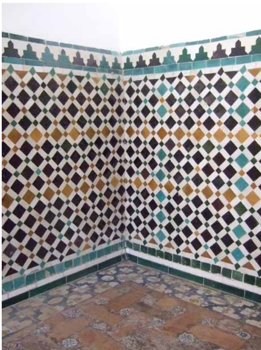
Fig. 4. Sala del techo de los Reyes Católicos. Real Alcázar.

Los alicatados mudéjares suelen ser clasificados de forma muy simple en dos grupos: «estrellerías» y «lacerías». En el primer caso, todos los aliceres muestran formas poligonales que se ajustan unas con otras, en contacto directo a pesar de sus variadas formas. En el segundo, tales polígonos aparecen separados por unas cintas que van trenzándose, pasando alternativamente por encima y por debajo de aquellas con las que se cruzan y formando sinos , candilejos , almendrillas , azafates , aspillas , costadillos y tarabeas . Todos los alicatados del Palacio Mudéjar responden genéricamente a estos dos grupos y a un repertorio geométrico cuyas leyes compositivas, junto con las de los yesos y las carpinterías, han sido ya objeto de varios estudios monográficos 18 . Pero considerando que esta geometría ha sido estudiada siempre desde una perspectiva técnico-gráfica y no tanto histórico-evolutiva, resulta arriesgado extraer de ella conclusiones de carácter cronológico. Tan sólo los diferentes niveles de complejidad y pericia técnica parecen revelar, a nuestro entender, un proceso de progresiva simplificación desde el siglo XIV hasta el XVI. No nos parece desacertado, en este sentido, establecer una provisional hipótesis de datación basada en estas evidencias materiales ya que coincidirían, además, con otras documenta-